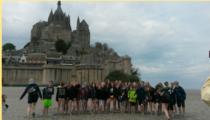
Unsere Schüler/innen beim Frankreichaustausch in St. Malo